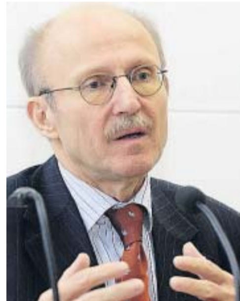
Warnt vor der braunen Gefahr an Bremens Schulen: Senator Willi Lemke.

Dabei arbeiten sie eng mit anderen Neonazi-Organisationen zusammen. Zum Beispiel mit den „Hammerskins“, die sich als elitäre „arische Bruderschaft“ verstehen und ihre regionalen Unterorganisationen „Chapter“ nennen. Das „Chapter Bremen“ ist laut Recherche-Nord nicht nur das einzige in Norddeutschland bekannte, sondern auch eines der ältesten in der Bundesrepublik. Die Rassist-Bewegung verfüge über ein internationales Netzwerk, entstanden sei sie in den USA und werde seit Anfang der 90er Jahre auch in Europa aufgebaut.