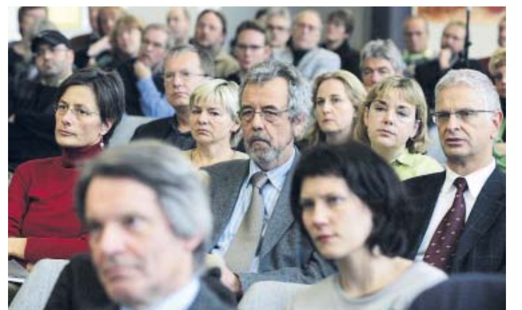
Ernste Mienen: Aufmerksam lauschten die Besucher den Vorträgen. Viele Informationen über die braune Gefahr waren für sie neu und erschreckend.