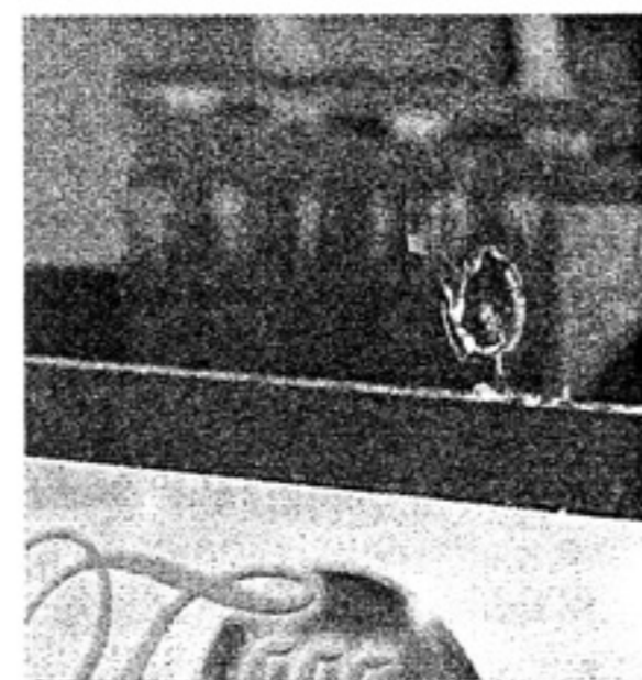
Zeugnis einer brutalen Auseinandersetzung.